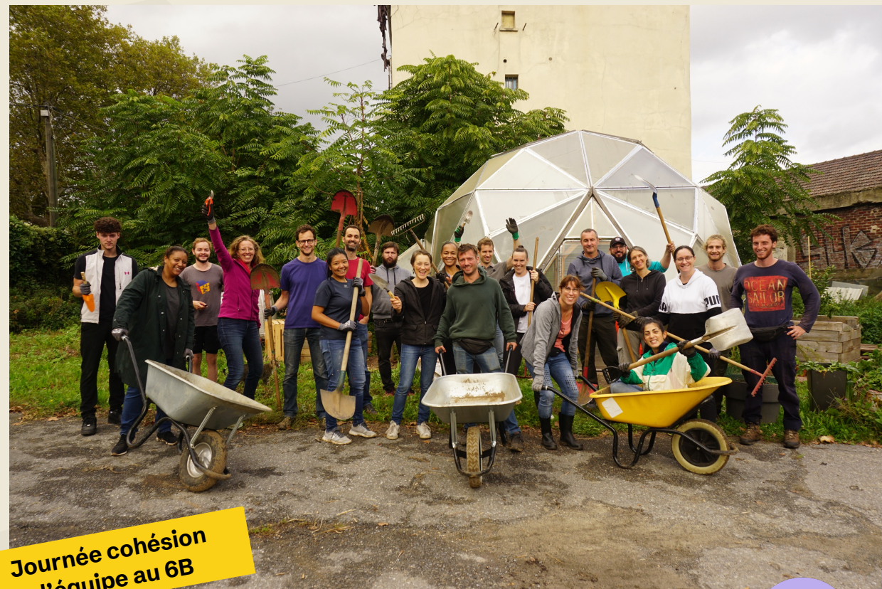
Journée cohésion d'équipe au 6B

Engrainage vous propose des journées de cohésion d'équipe permettant de renforcer les liens entre les collaborateurs, tout en soutenant des projets écologiques et l'ancrage local et social de votre entreprise !